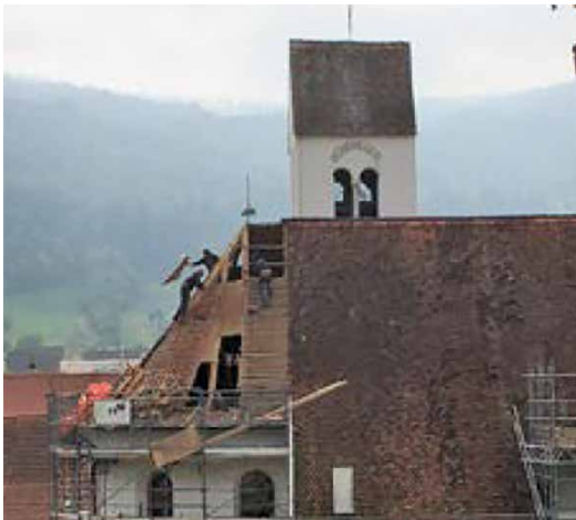
Dachsanierung in luftiger Höhe oberhalb des Chors der Kirche in Hofstetten

Mit der traditionellen Epiphaniekollekte unterstützt die Inländische Mission im Jahr 2024 die Restaurierung von drei Kirchen, die dringend auf auswärtige Hilfe angewiesen sind.