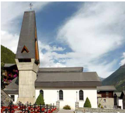
Die Kirche Königin des Friedens in Wiler VS, mit beschädigtem Dach