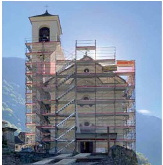
Die eingerüstete Pfarrkirche Maria der Engel im Verzascatal

Diese Kirchen sind für die Seelsorge wichtig und verdienen es, als eindrucksvolle Zeugen des Glaubens für die Zukunft bereit gemacht und erhalten zu werden.