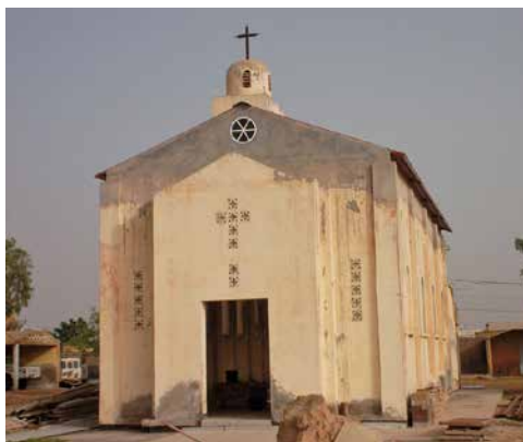
Die Kirche von Rosso, Mauretanien

«Kirche in Not (ACN)» ist ein internationales katholisches Hilfswerk päpstlichen Rechts, das 1947 als «Ostpriesterhilfe» gegründet wurde. Es steht mit Hilfsaktionen, Informationstätigkeit und Gebet für bedrängte und Not leidende Christen in rund 140 Ländern ein. Seine Projekte sind ausschliesslich privat finanziert. Das Hilfswerk wird von der Schweizer Bischofskonferenz für Spenden empfohlen.