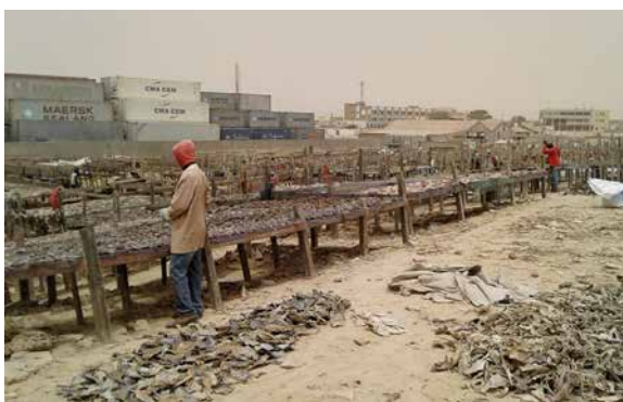
Am Hafen von Nouadhibou wird Fisch getrocknet