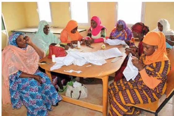
Frauen bei der Berufsbildung, Mauretanien